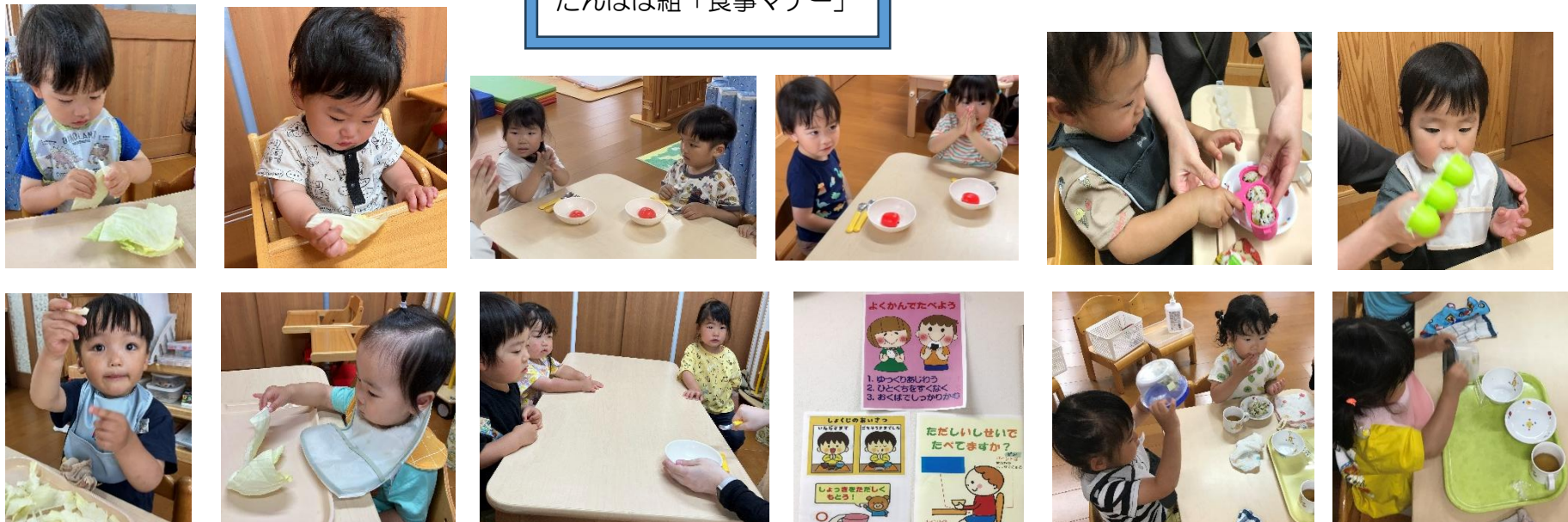
ミニクッキング「ふりふりおにぎり」