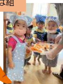
人参の型抜きやこんにゃくちぎりも上手に出来ました👏