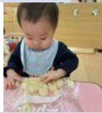
じゃがいも潰しに挑戦しました♪

4月には、苦手な食材がたくさんあったテラスハウス保育園のみんなも、少しずつ好き嫌いが減ってきましたよ。来年度も、お友達と一緒に楽しく給食を食べようね😊