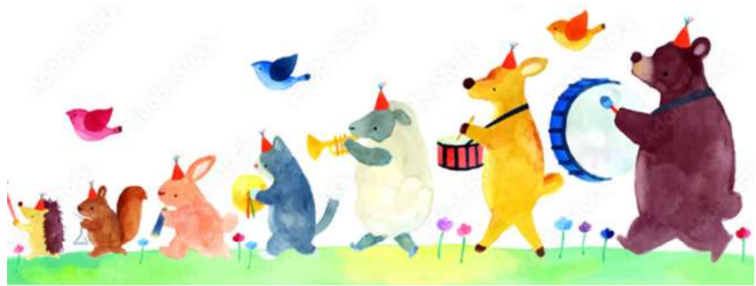
バンビーノハウス保育園

今年度も、本園の教育・保育に関しまして、保護者の皆様にはご理解・ご協力いただき、大変感謝致しております。今後も、保護者の皆様と連携を図りながら、お子様の成長と一緒に考えていけたらと思っております。宜しくお願い致します。